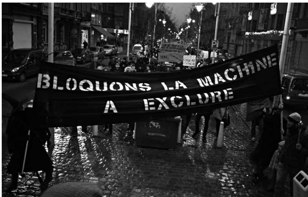
MANIFESTATION ORGANISÉE PAR LE COLLECTIF RIPOSTE-CTE, QUI SOUTIENT CERTAINES DES THÈSES EXPRIMÉES DANS CHOMING OUT .

Les auteurs ne sont pas avares d'épisodes historiques exemplaires, telle la fondation, en 1848, des caisses de résistance, de grève et de chômage par les typo-