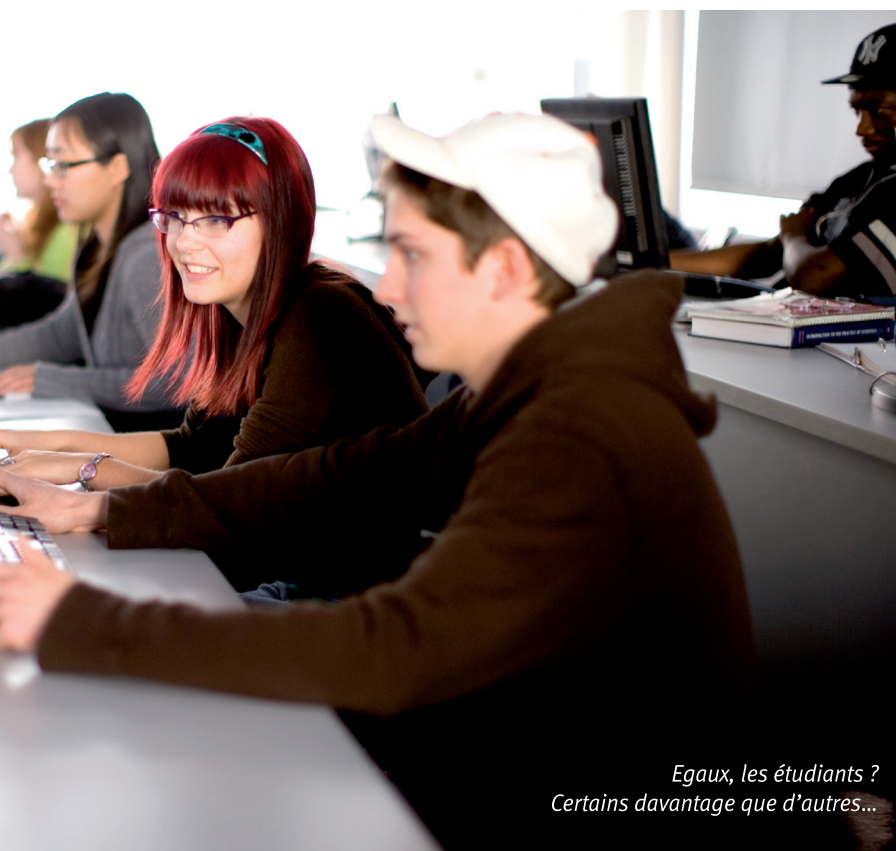
Egax, les étudiants ? Certains davantage que d'autres...

Enfin, la troisième hypothèse qui rejoint ce que le sociologue Pierre Bourdieu appelle le « racisme de l'intelligence » s'est trouvée confirmée dans quelques cas dans le cadre